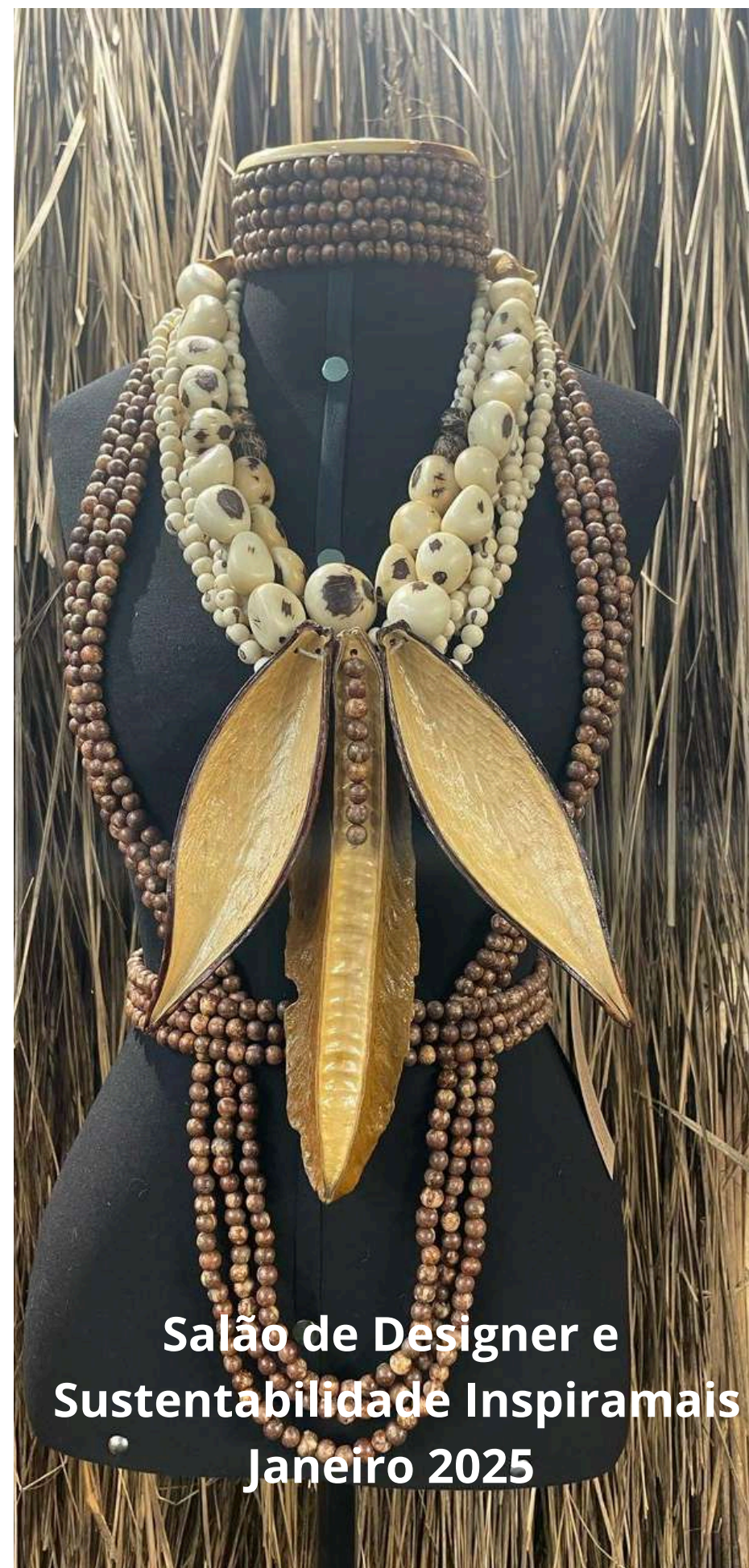
Salão de Designer e Sustentabilidade Inspiramais Janeiro 2025