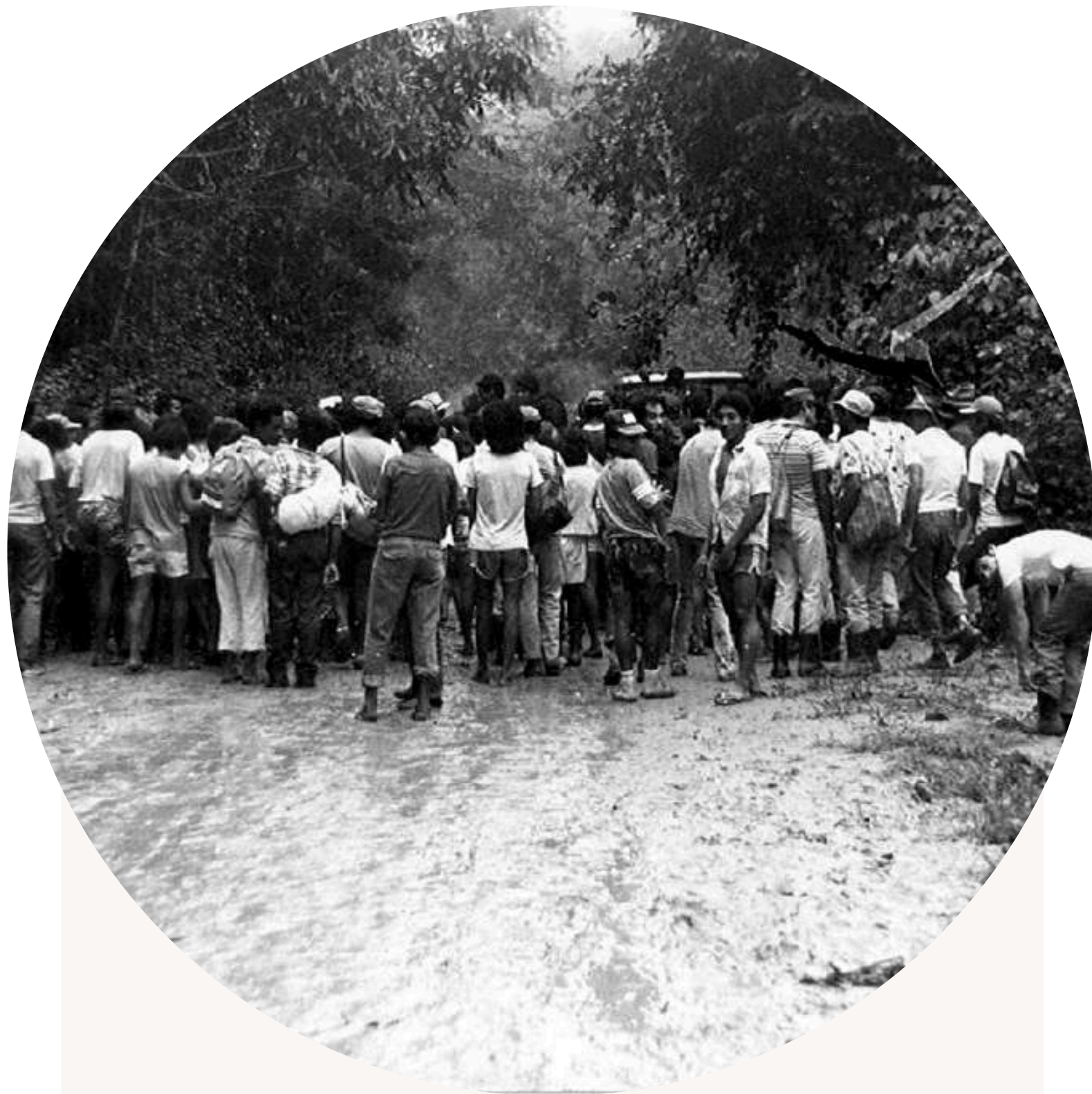
Empates - Barreira humana para impedir a derrubada da floresta

A APPANSS nasceu em 2004, mas nossa história começa muito antes, nas décadas de 1970 e 1980, quando nossos avós e bisavós nordestinos que ocuparam a Amazônia resistiram bravamente à ameaça da pecuária e as pressões pela expulsão de nossas terras. Nossa luta deu origem a Reserva Extrativista Chico Mendes, território de vida, floresta e cultura no Alto Acre, a maior área produtora de Castanha-da-Amazônia, coletada de forma tradicional pelas mãos dos eguadioês da floresta. Carregamos no sangue a memória dos nossos antepassados e, no trabalho diário, a renovação desse legado.