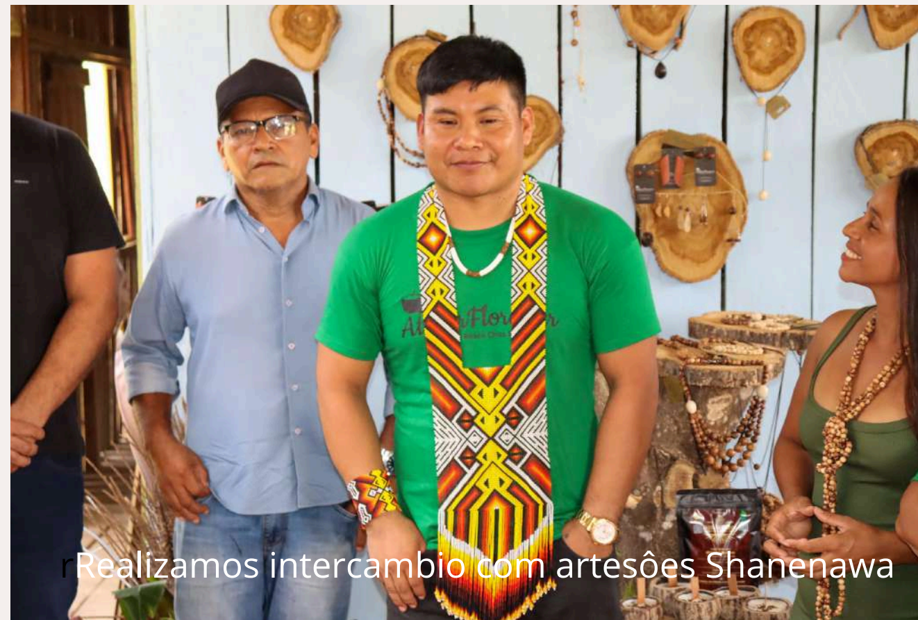
Realizamos intercâmbio com artesões Shanenawa