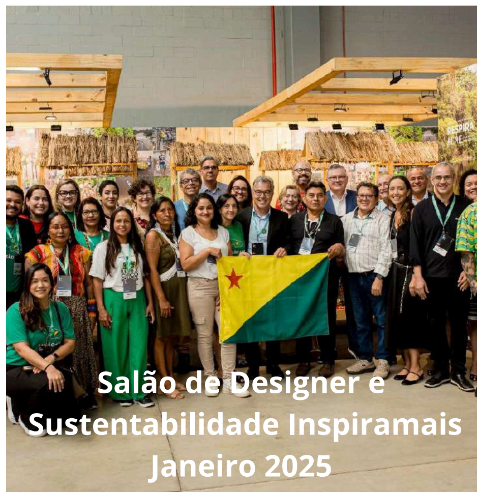
Salão de Designer e Sustentabilidade Inspiramais Janeiro 2025