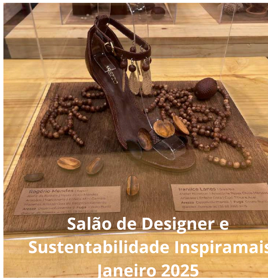
Salão de Designer e Sustentabilidade Inspiramais Janeiro 2025

Salão de Design no Rio Grande do Sul Inspira Mais – evento de inovação em moda e sustentabilidade Parceria nos projetos SEBRAE e APEX Brasil – Respira Amazônia Intercâmbio Cultural com Povos Indígenas: trocamos sementes, saberes e fortalecemos laços de resistência no Ateliê Florescer.